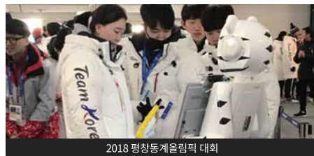
2018 평창동계올림픽 대회