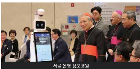
서울 은평 성모병원