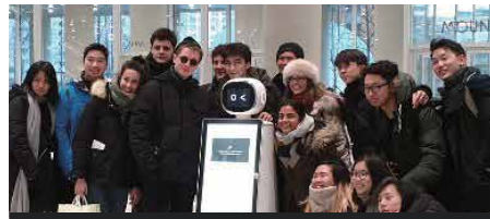
아모레퍼시픽 그룹 본사