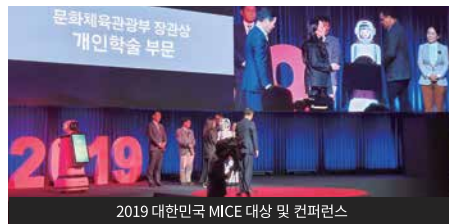
2019 대한민국 MICE 대상 및 컨퍼런스