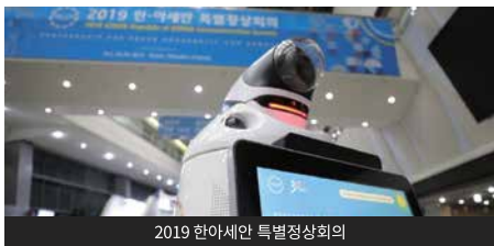
2019 한아세안 특별정상회의