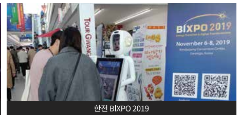
한진 BIXPO 2019