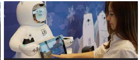
세븐 일레븐 무인 매장