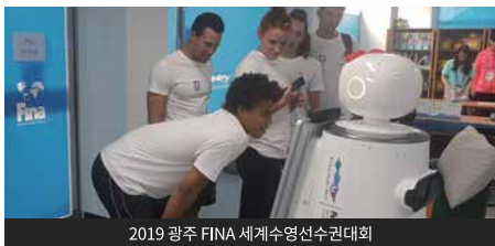
2019 광주 FINA 세계수영선수권대회