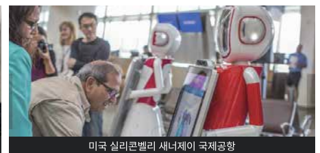
미국 실리컨벨리 새너제이 국제공항